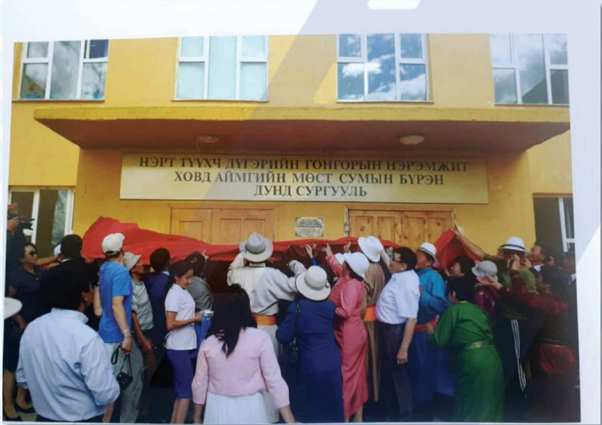
Ховд аймгийн Мөст сумын бүрэн дунд сургуулийг түүхч Д.Гонгорын нэрэмжит болгох нээлтийн ёслолын ажиллагаа. 2017.08.04