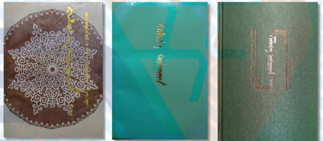
Өвөр Монголд хэвлэгдсэн Д.Гонгорын “Халх товчоон” I, II боть. 1990, 1991, 2014 он