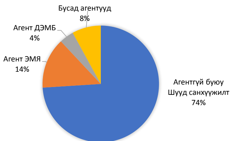
Зураг 2. КОВИД-19-ийн үеийн эрүүл мэндийн салбар дахь санхүүгийн агентууд

Азийн хөгжлийн банкны санхүүжилтээр хэрэгжиж буй “Эрүүл мэндийн салбар хөгжил хөтөлбөр- 5 + Онцгой байдлын тусламжийн нэмэлт санхүүжилт” төслийн хүрээнд 77,9 тэрбум төгрөгийн хөрөнгө оруулалт хийгдэж байгаа ба гүйцэтгэгчийг шалгаруулах ажлыг Азийн хөгжлийн банк хийж байна.