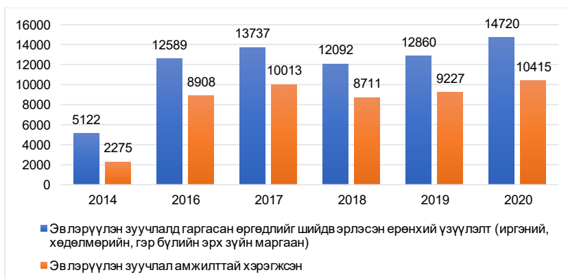
Хүснэгт 6. Эвлэрүүлэн зуучлах ажиллагааны хэрэгжилт 25

Эвлэрүүлэн зуучлалын тухай хуулийг 2002 онд баталж, 2013 оны 07 дугаар сарын 01-ний өдрөөс мөрдсөн бөгөөд иргэний хэргийн анхан шатны бүх шүүхэд орон тооны эвлэрүүлэн зуучлагч ажиллаж, хэрэг маргааныг хянан шийдвэрлэх шинэ аргыг нэвтрүүлсэн юм. Үүнээс хойш эвлэрүүлэн зуучлалд гаргасан өргөдлийг шийдвэрлэсэн үзүүлэлтийг Хүснэгт 5, 6-аас үзнэ үү.