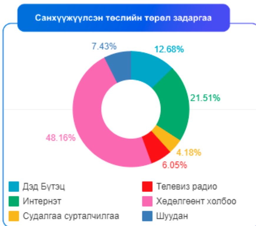
Зураг 3. Санхүүжүүлсэн төслийн төрөл задаргаа

2009 оноос 2022 оны хооронд Бүх нийтийн үйлчилгээний үүргийн санд үйлчилгээ эрхлэгчдээс нийт 47,407,970,324 төгрөг татан төвлөрүүлж 38,655,669,820 төгрөгөөр төсөл, арга хэмжээг санхүүжүүлсэн байна. 27