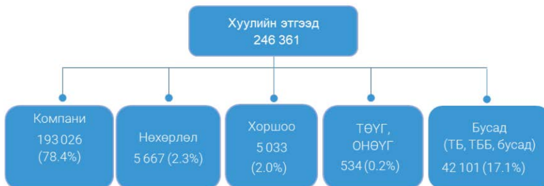
Зураг 1. 2022 оны Бизнес Регистрийн Санд бүртгэлтэй аж ахуйн нэгж, байгууллагын тоо /хариуцлагын хэлбэрээр/ 10

Үйл ажиллагаа явуулсан хуулийн этгээдийг ажиллагчдын тооны бүлгээр авч үзэхэд 1-9 ажиллагчидтай хуулийн этгээд 84.1 хувийг, 10-19 ажиллагчидтай хуулийн этгээд 7.4 хувийг, 20-49 ажиллагчидтай хуулийн этгээд 5.6 хувийг, 50 ба түүнээс дээш ажиллагчидтай хуулийн этгээд 3.0 хувийг тус тус эзэлж байна. 1-9 ажиллагчидтай хуулийн этгээдийн эзлэх хувь өмнөх оны мөн үеэс 0.9 нэгж хувиар өссөн байна. 11 Өөрөөр хэлбэл, Монгол Улсад жижиг, дунд бизнес эрхлэлт илүү