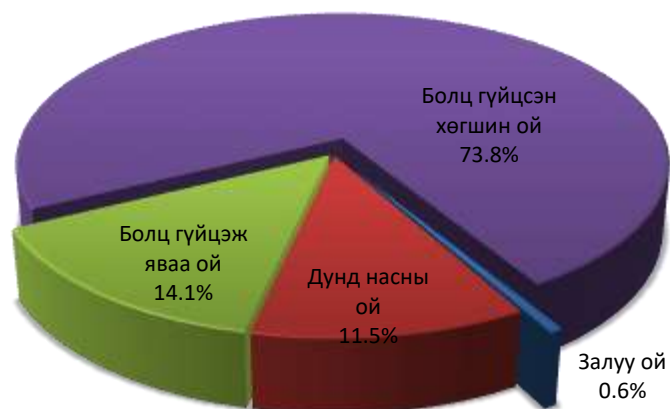
Ойн нөөцөд насны бүлгийн эзлэх хувь

Навч, шилмүүст ойн нөөцийг техникийн болцоор тооцож насны бүлгээр ангилж үзвэл талбайн 14.5 хувь, нөөцийн 14.1 хувийг болц гүйцэж яваа, талбайн 65.9 хувь, нөөцийн 73.8 хувийг болц гүйцсэн, хөгшин ой эзэлж байна.