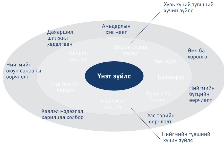
Зураг 1. Үнэт зүйлст нөлөөлөх хүчин зүйлс