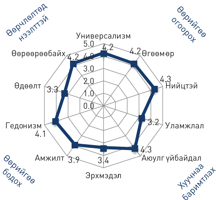
Зураг 3. Үнэт зүйлсийн дундаж

Үнэт зүйл нэг бүрийн үнэлгээний харьцуулалт. 10 үнэт зүйлийн дундажийн үнэлгээ нь 56 нэгж үнэт зүйл бүрийн хүч нөлөөг бүрэн илтгэхгүй тул судалгаанд оролцогчдын хариултад аль үнэт зүйл онцгой чухал, чухал гэж үнэлэгдэж, аль нь чухал бусад тооцогдож байгааг ялгах шаардлагатай юм (Хүснэгт 10). Судалгаанд оролцсон 797 хүнээс SVS загварын 56 үзүүлэлтээс сэтгэл хангалуун байдал (655 хүн), эцэг эх ахмад үеэ хүндлэх (652 хүн), эрүүл мэнд (622 хүн), үнэнч байдал (597 хүн), байгаль орчноо хамгаалах (595 хүн), шударга зан (591 хүн), ухаалаг байдал (560 хүн), мэдлэг чадвар (560 хүн) онцгой чухал