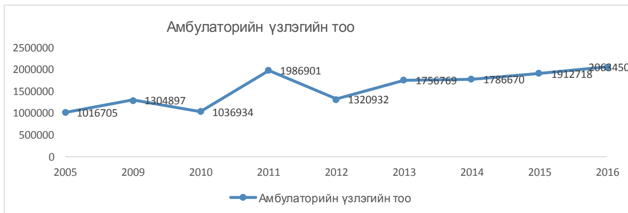
Зураг 7. Хувийн эмнэлгийн амбулаторийн үзлэгийн тоо, 2005-2016 он

Эх үүсвэр: ЭМХТөвийн Эрүүл мэндийн үзүүлэлт-2016