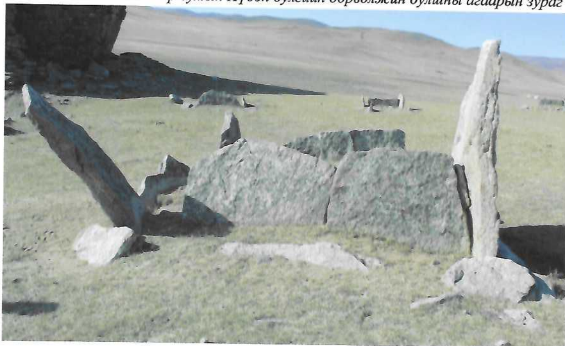
Хашлага нь улаан зостой дөрвөлжин були