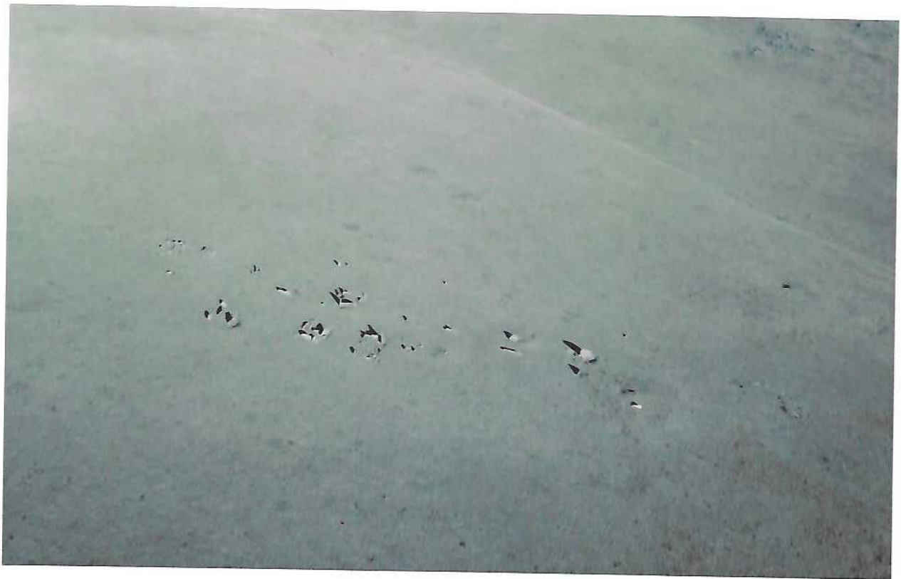
Адуун чулууны дөрвөлжин бушины агаарын зураг