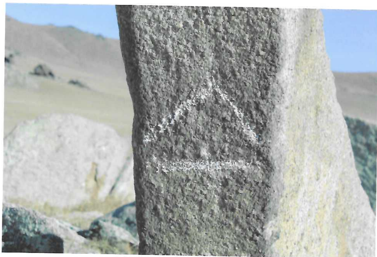
Нүдэн булгийн дөрвөлжин булш