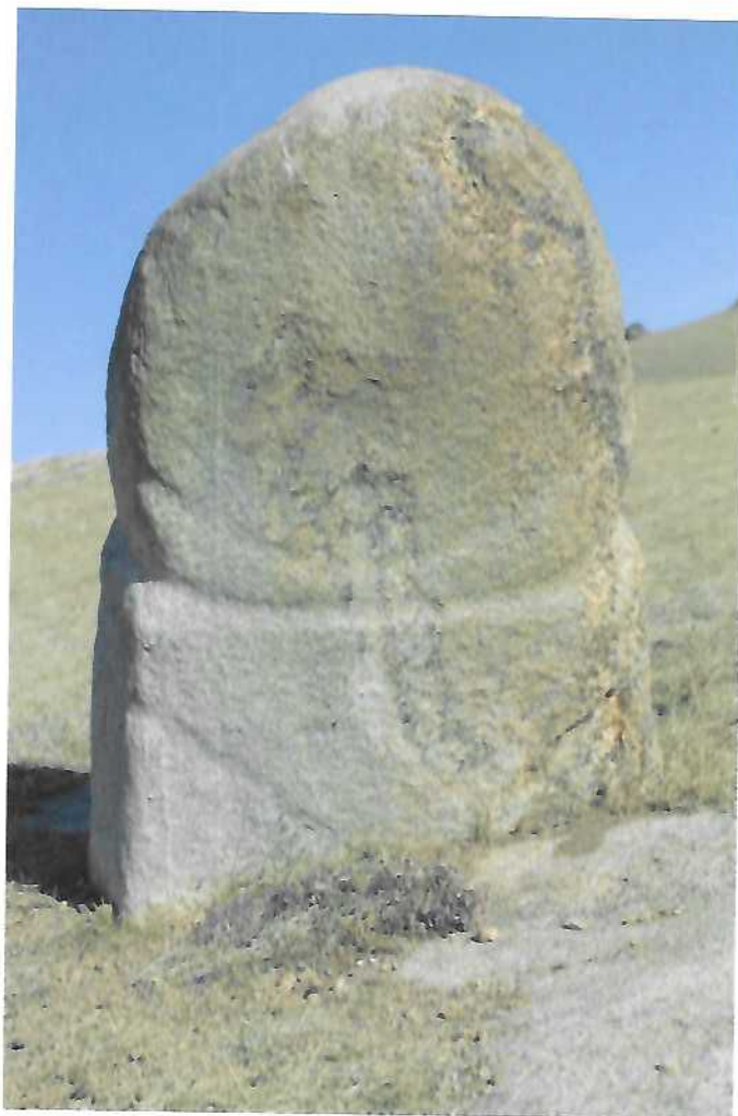
Адуун чулууны хөшөө чулуу

Адуун чулууны хөшөө чулуу: Адуун чулууны дөрвөлжин булш нь уулын энгэрт хэсэг бүлгээр байрлах бөгөөд уулын оройд 4x3 м орчим хэмжээтэй дөрвөлжин булшны зүүн хойна 10 орчим метр зайд нүүрээр нь дөрвөлжин булшны буюу зүүн зүгт хандуулан босгосон хөшөө чулуу аж. Газрын уруу хазаасан байдалтай, нүүрэн талд хүний нүүрийн зарим эрхтнийг болхи байдлаар дүрсэлсэн байна. Хөшөө чулууны өндөр 70 см, мөрний өргөн 45 см, эрүү хүртэл 42 см, нүүрийн өргөн 42 см, чулууны зузаан 16 см.