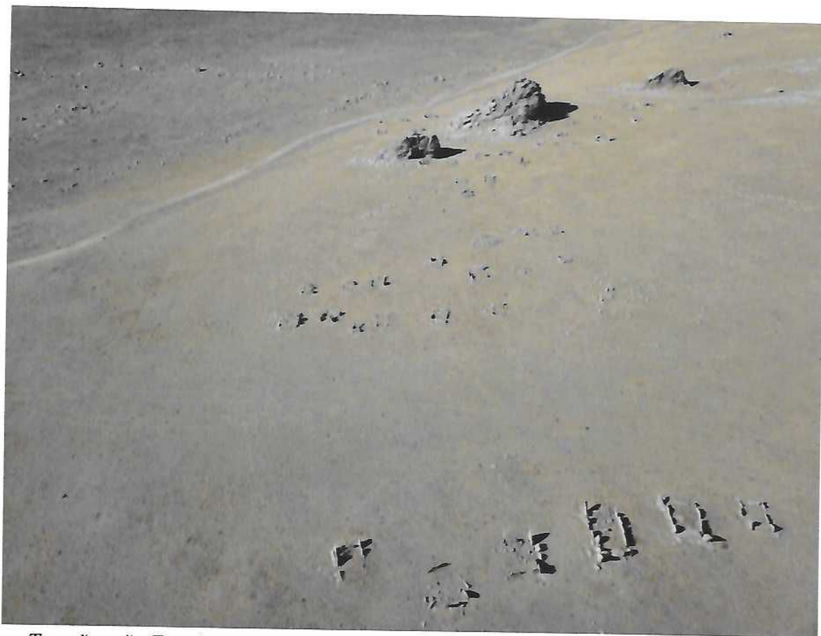
Төв аймгийн Баяндэлгэр сумын Нүдэн булгийн дөрвөлжин булины агаарын зураг