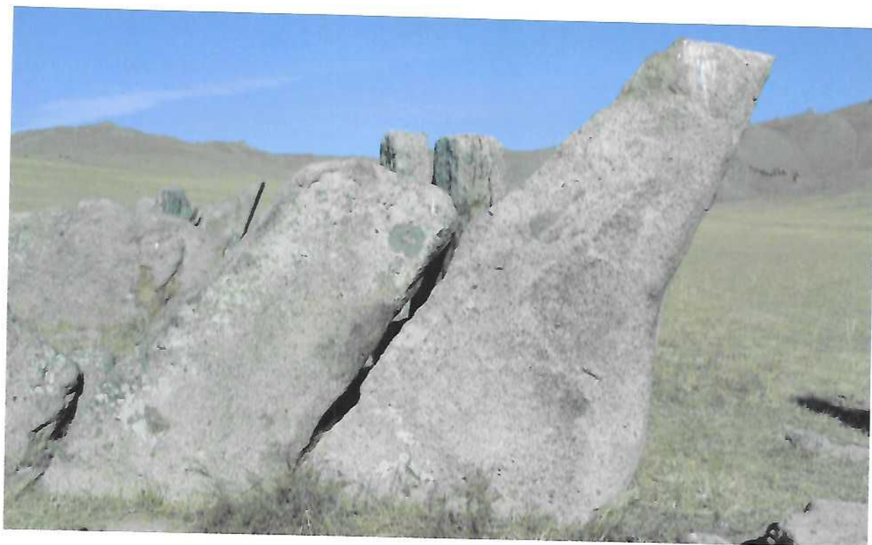
Нүдэн булгийн дөрвөлжин булшны хашлага чулуун дээрх буга