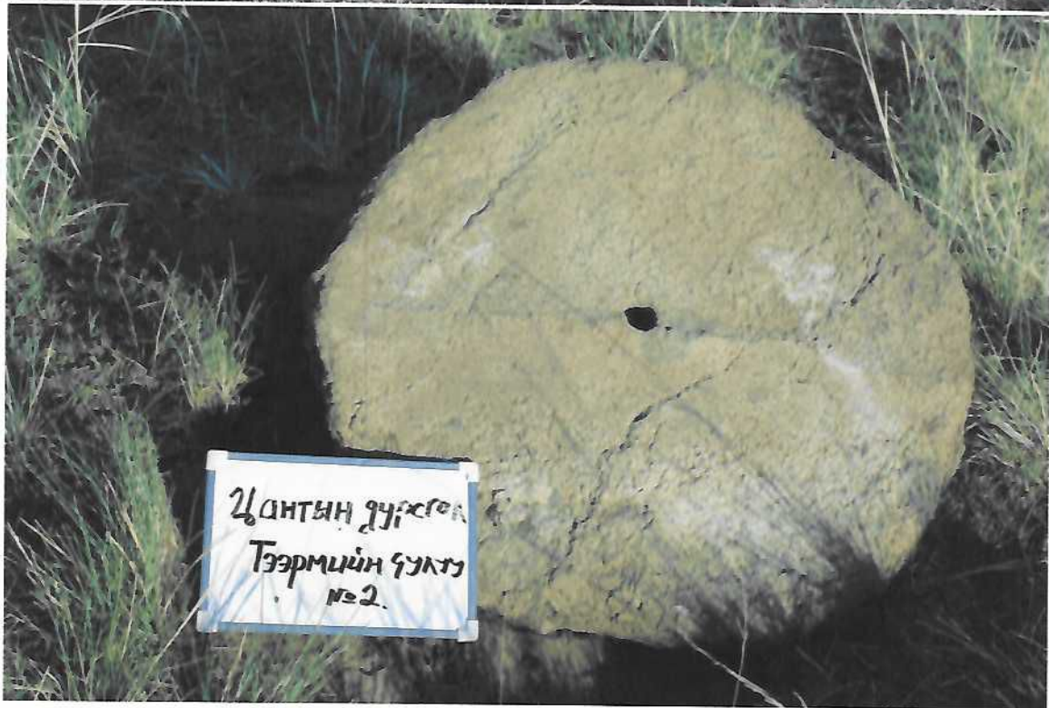
Тээрмийн чулуудын заримаас