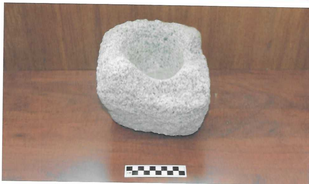
Чулуун уур (Түүвэр олдвор)