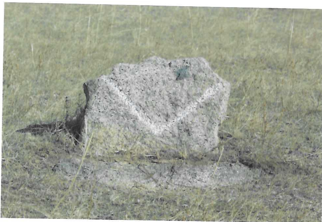
Нүдэн булгийн хөшөө чулуу 2