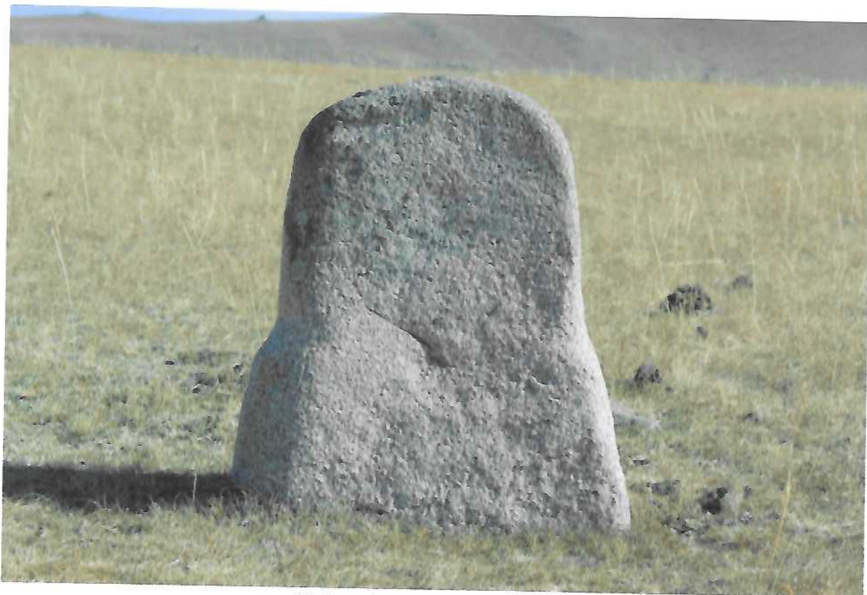
Нүдэн булгийн хөшөө чулуу 1

Хөшөө чулуу 1. Эгнээ бүхүй дөрвөлжин булшны зүүн талд булшнаас 770 см зайд хүний төрх оруулан үйлдсэн болхи хийцтэй хөшөө чулууг нүүрийг баруун тийш харуулан газарт босгожээ. Хөшөө чулууны хөрс газрын хөрснөөс 60 см, өргөн доогуураа 50 см, толгой өндөр 37 см, толгойн өргөн 39 см, чулууны зузаан 13 см. Хөшөө чулуунаас чанх урагш 10 орчим чулууг газар зоосон байна.