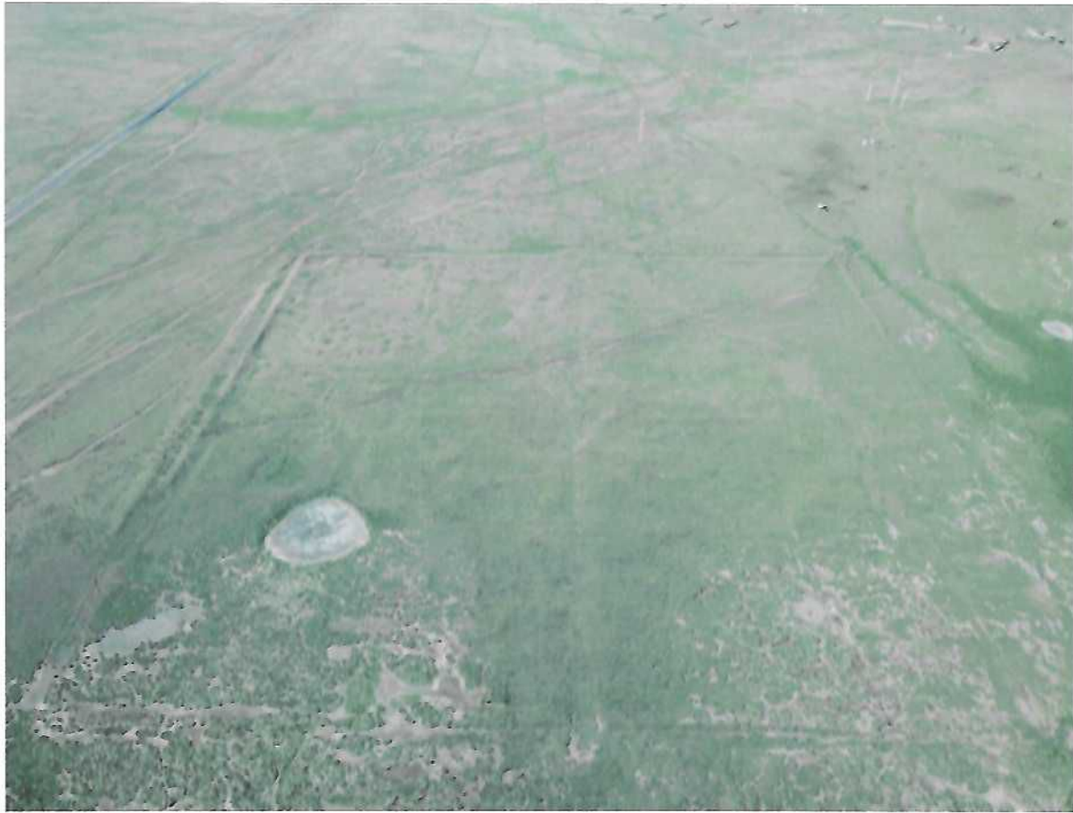
Цантын дэрсний балгасны агаарын зураг /хойт талаас/

Цантын дэрсний балгасыг судлаачид XIY зууны үеийн дурсгал гэж үздэг. Хэрэмд буй дугуй тойрог бүхүй хоёр ширхэг чулуун тээрэм нь судлаачдын сонирхлыг ихэд татсаар ирсэн бөгөөд А.Очир тэргүүтэй дотоод, гадаадын эрдэмтэд үзэж судлаад, энэ нь цаас боловсруулах тээрэм мөн болхыг тогтоосон нь монголчуудын үйлдвэрлэлийн түүхэнд гаргасан томоохон ололт, амжилт мөн болохыг тогтоосон нь шинжлэх ухааны өндөр ач холбогдолтой юм. Чулуун тээрмийг өмнөд тал бүхүйг нь Тээрэм -1, түүний хойно оршихийг нь Тээрэм-2 гэж дугаарлан тодорхойлолт үйлдэв.