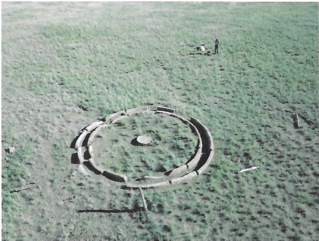
Чулуун тээрэм – 1. Агаарын зураг /баруун хойноос/