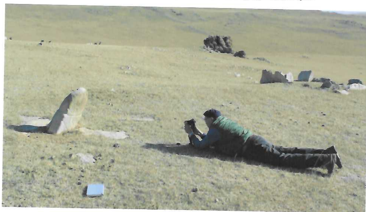
Судалгаа хийж буй байдал