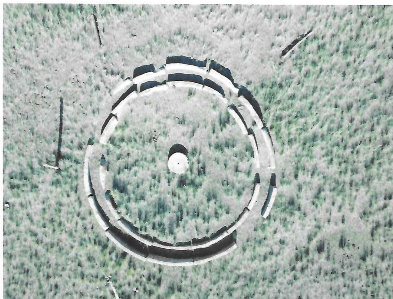
Чулуун тээрэм – 1. Агаарын зураг /дээрээс/