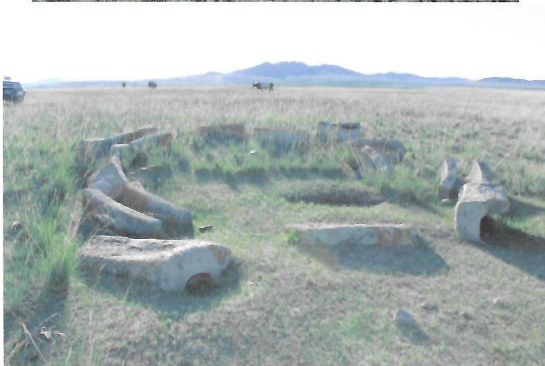
Тээрэм -2. /Агаарын болон фото зураг/