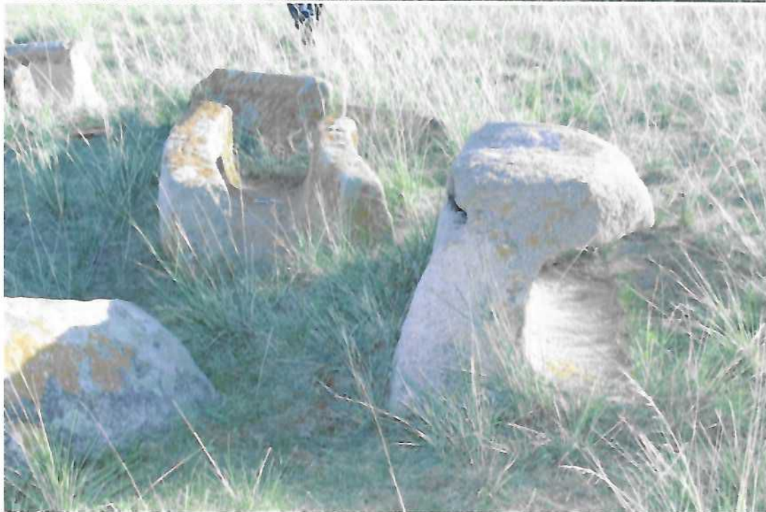
Чулуун тээрмийн деталь хэсгүүд

Хэрэмд дээрх 2 ширхэг цаас боловсруулах чулуун тээрэм байхаас гадна тариа цайруулах, боловсруулах, гурил хийх чулуун тээрмийн үлдэгдлүүд маш олон тоотой олдож байна. Тэдгээр чулуун тээрэм нь дугуй хэлбэртэй, тойргийн голч нь 80-100 орчим см, голдоо 4x4 см, гүн нь 7 хүртэлх см дөрвөлжин нүхтэй, Эдгээрийн зарим нь хагарсан