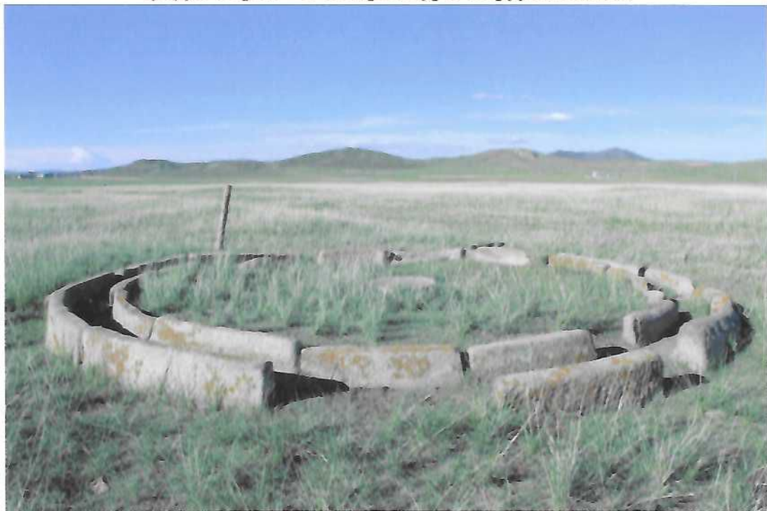
Чулуун тээрэм – 1. /хажуугаас/