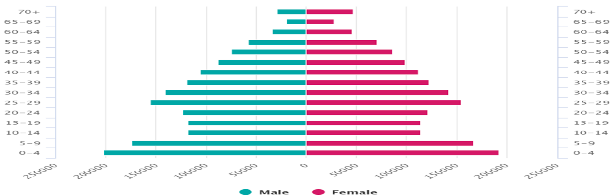
Зураг 1.1: Монгол улсын хүн амын нас хүйсийн суварга, 2017

Монгол орон нь 3,2 сая хүн амтай харьцангуй залуу орон бөгөөд нийт хүн амын 64 хувь нь 30-аас доош настай байна (Үндэсний Статистикийн Хороо, 2017). Хүн амын насны суваргыг харахад хамгийн том насны бүлэг нь 0-4 настай хүүхдүүд буюу нийт 394,000 хүүхэд байгаа бол хоёр дахь том бүлэг нь мөн 5-9 насны 341,000 хүүхэд байна.