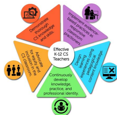
Хүснэмт 2. 2020 CS Standarts for Computer Science Teachers